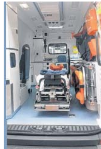
Blick in den Rettungswagen: Pritsche und Spezialausrüstung.

Der DRK-Ortsverein plant die Anschaffung einer mobilen Sanitätsstation. Die Kosten eines derartigen Spezialfahrzeugs belaufen sich auf etwa 52.500 Euro. Die Retter würden sich sehr über weitere Spenden freuen. Infos und Kontakt unter www.drk-badlippspringe.de .