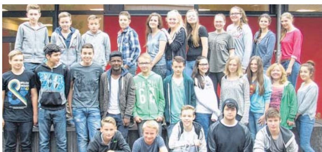
Engagierte Reporter: Die Schüler der Klasse 8d haben seit nach den Osterferien die NW im Unterricht gelesen und dann selbst fleißig für diese Seite recherchiert, fotografiert und geschrieben.

◆ Ihr Fazit: Das Zeitungsprojekt hat uns sehr gut gefallen. Noch nie waren wir so auf dem Laufenden. Wir konnten uns im Deutschunterricht intensiv mit der Zeitung auseinandersetzen.