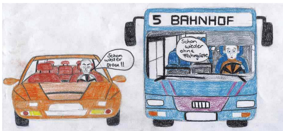
ILLUSTRATION: THERESA SCHWIND