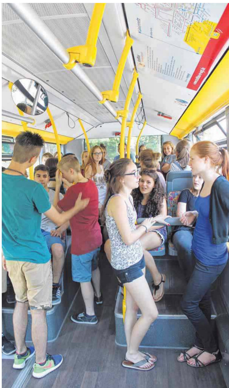
Drangvolle Enge im Schulbus erleben Kinder und Jugendliche täglich. Für die Klasse 9b des Ravensburger Spohn-Gymnasiums Grund genug, das Busfahren zum Thema ihrer Projektseite zu machen. In Interviews, Reportagen und Umfragen versuchten die Schüler, die sich fürs Foto im Bus versammelten, alle Seiten zu Wort kommen zu lassen.

Schließlich kann ich der Müdigkeit endlich nachgeben und schließe